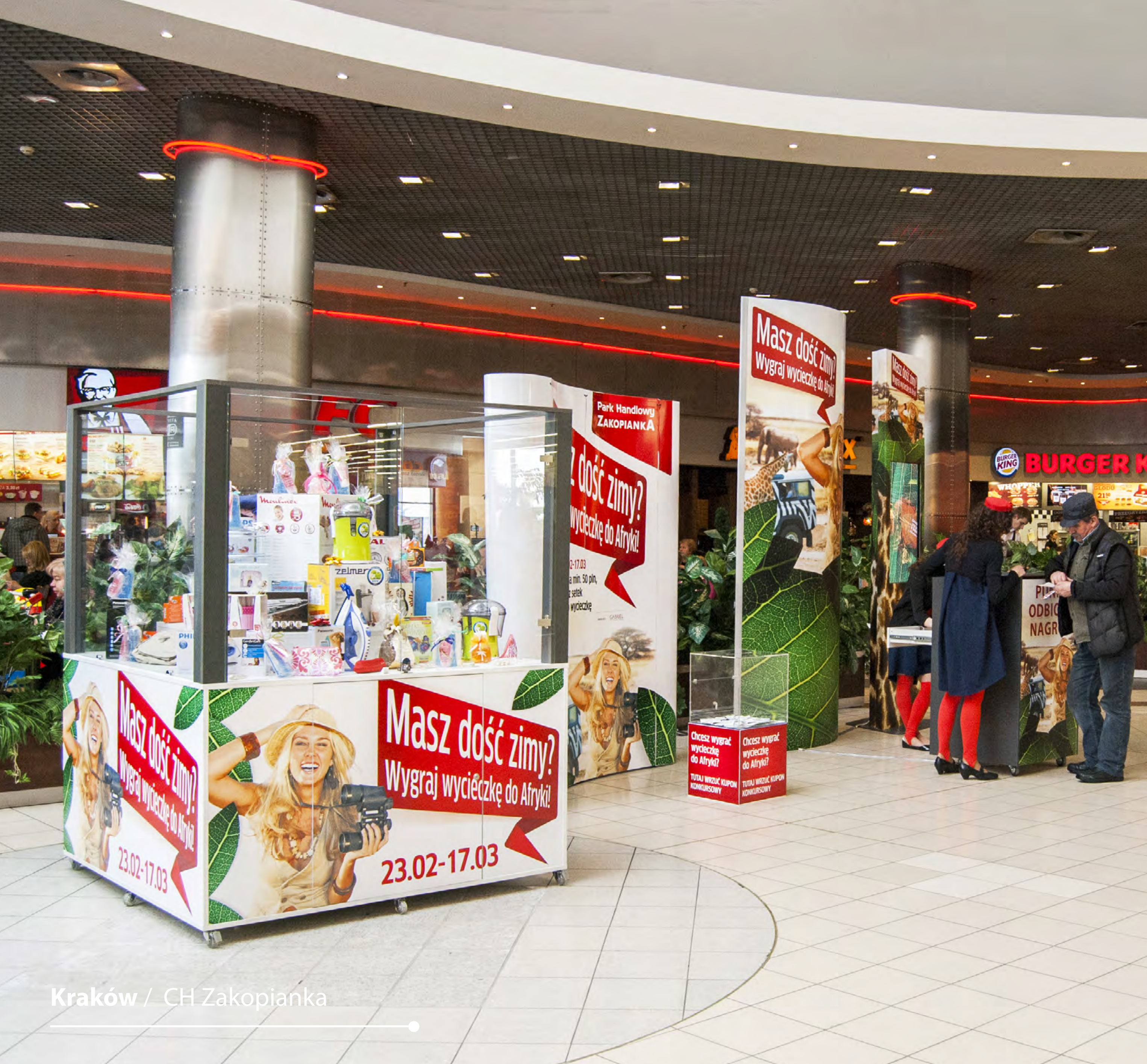
Kraków / CH Zakopianka