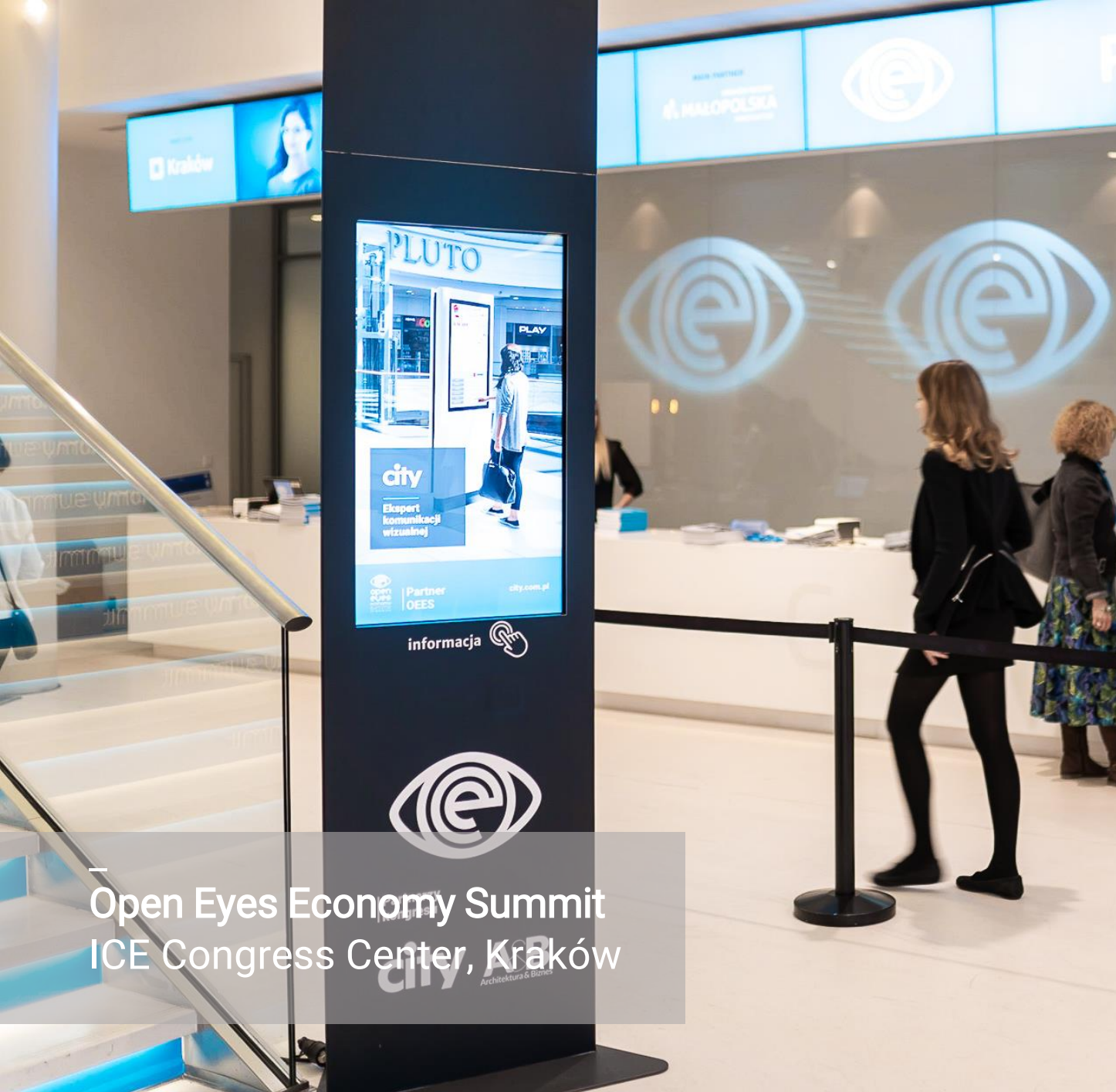
Open Eyes Economy Summit ICE Congress Center, Kraków