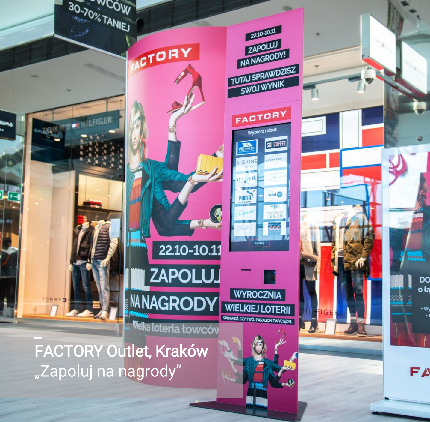
FACTORY Outlet, Kraków „Zapoluj na nagrody”